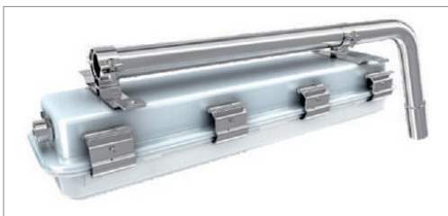
הרכבה על מוט / עמוד